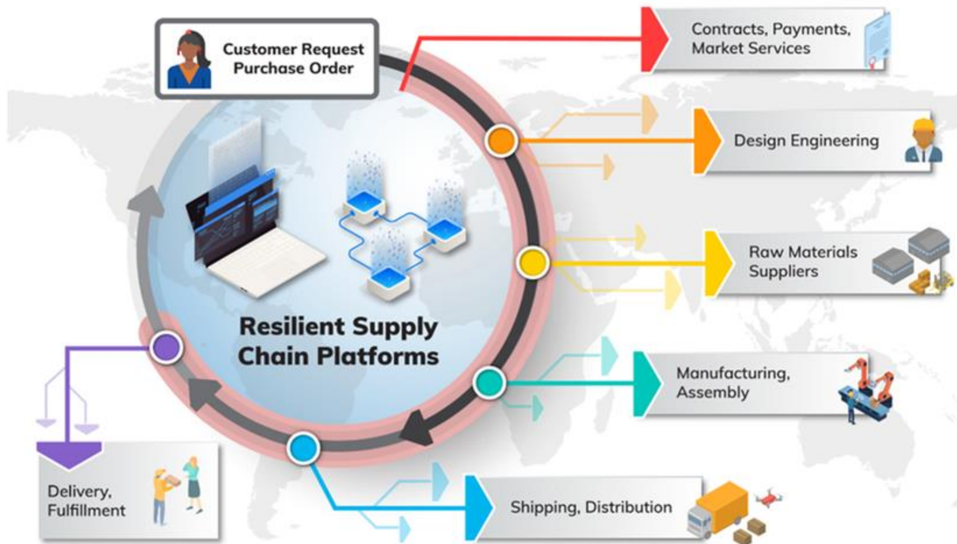
Manufacturing supply chain activities and data